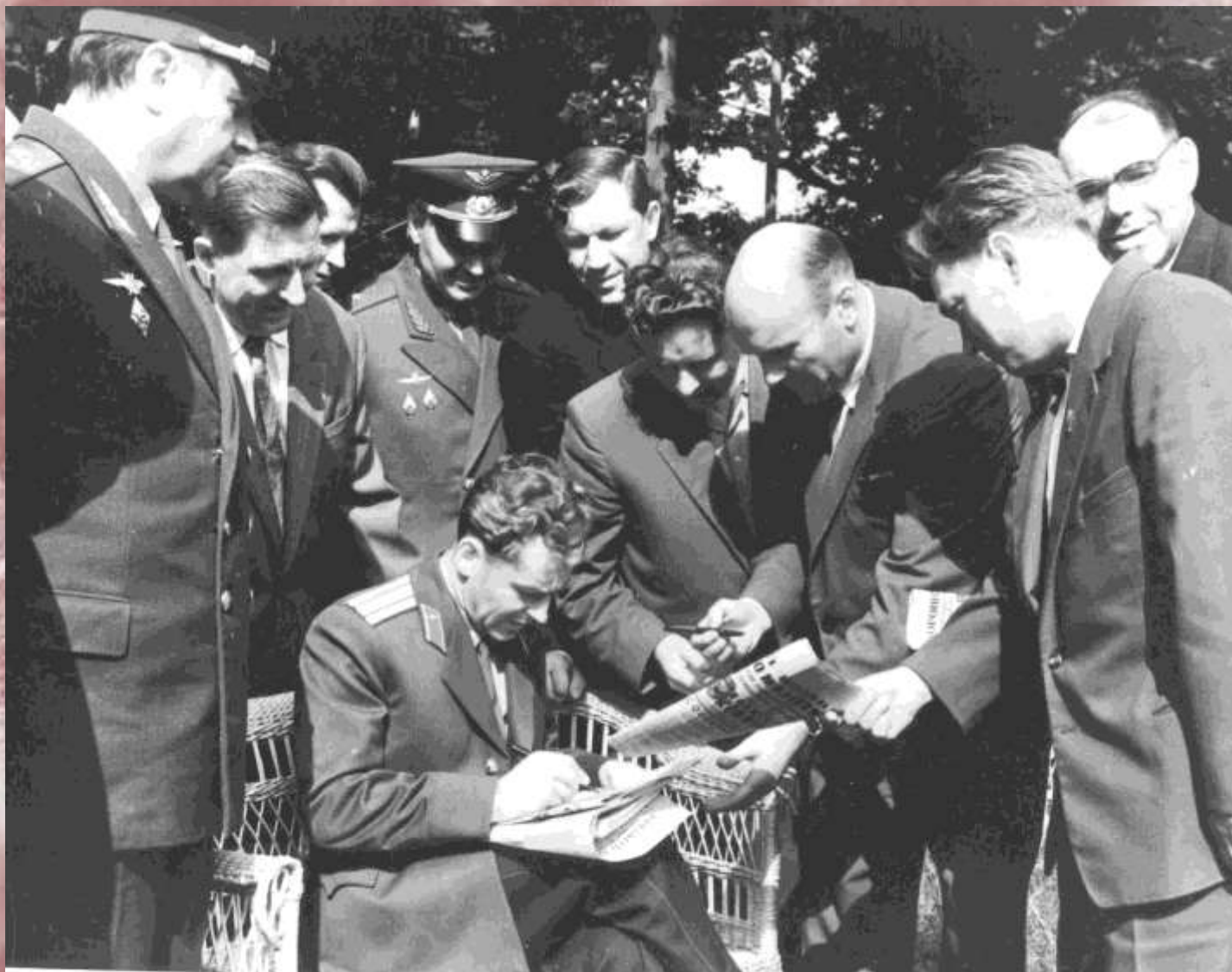
Летчик-космонавт Г.С.Титов дает автографы. Куйбышев. 1964 г.