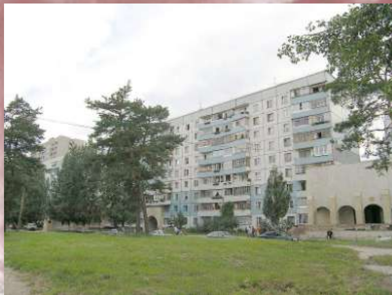
г.Тольятти, улица А.С. Мурысева.