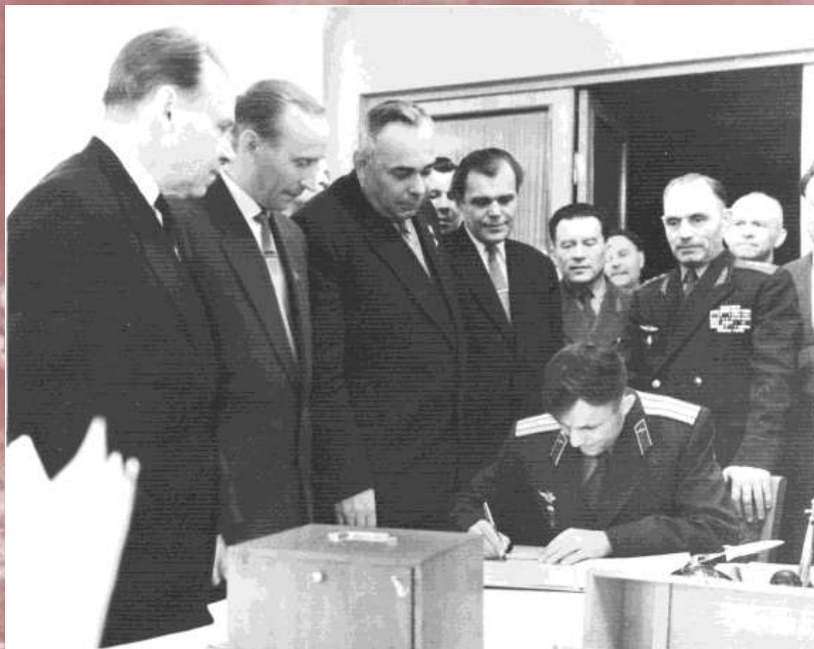
Летчик-космонавт Ю.А. Гагарин в Куйбышеве. 3-й слева – Первый секретарь Куйбышевского обкома КПСС А.С. Мурысев.