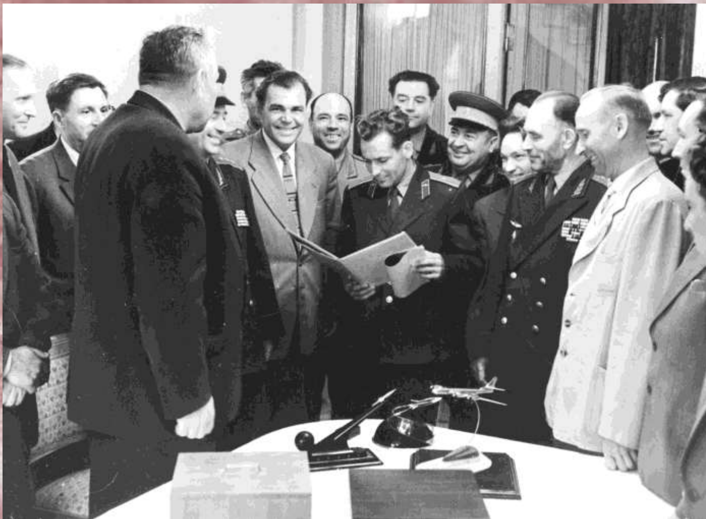
Летчик-космонавт СССР Г.С. Титов в Куйбышеве. 1-й слева Первый секретарь Куйбышевского обкома КПСС А.С. Мурысев