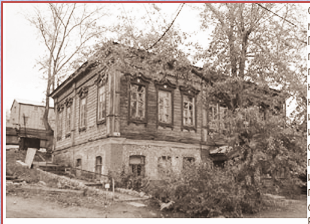
Ставропольская земская больница, в здании которой размещалась Ставропольская районная больница в 1918-1951 г.