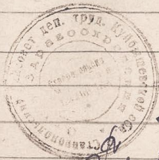
Смета расходов подсобного хозяйства райбольницы в 1949 г.