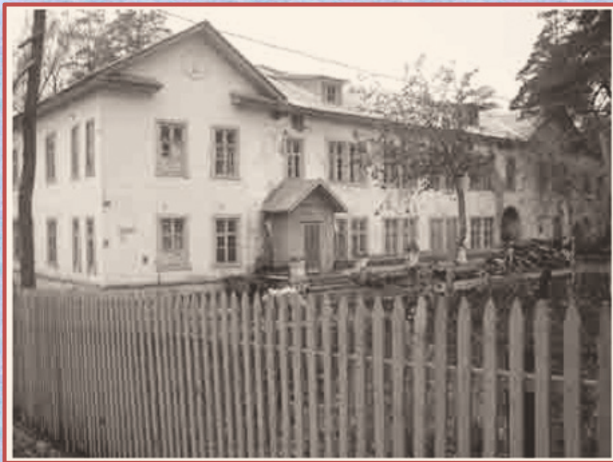
Портбольница Куйбышевгидростроя. 1952 г.