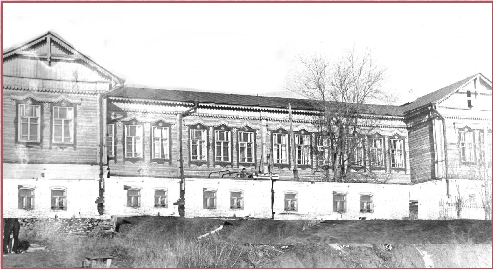
Главный корпус ставропольской районной больницы