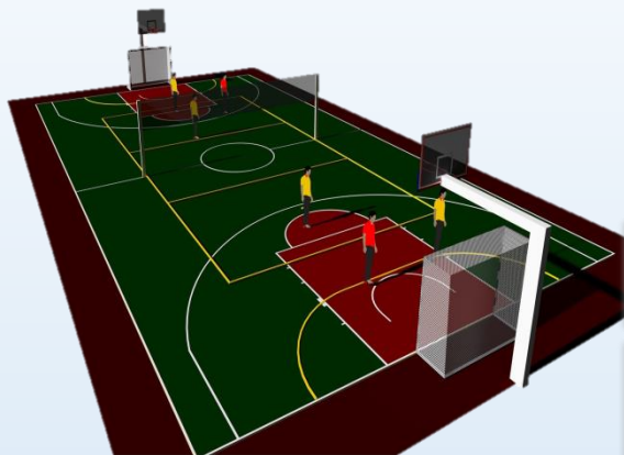
Произвольный вариант проекта